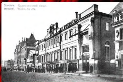
Московский художественный театр